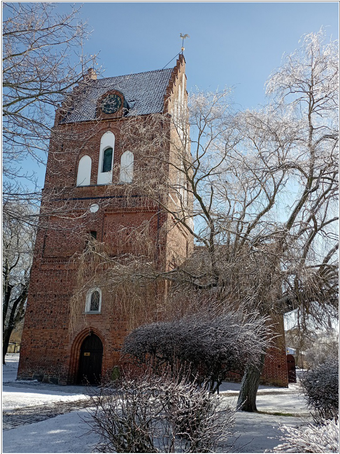
Sankt Nicolai Kyrkan i Sölvesborg ifrån slutet av 1200-talets Östdanmarks Regentid!

Inbördes ordning är oviktigt men Vi önskar att det genomförs logiskt och relevant med vissa objekt som fasas in i andra pågående projekt så Vi utnyttjar tiden på bästa sätt som blir mycket optimalt av varje byggnation. Denna tillhör både affärsplan & affärsbudget som upprättades den 17-19/4 2023.